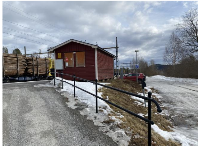
Ramp till plattform saknar kontrastmarkering och ledstång på båda sidor.