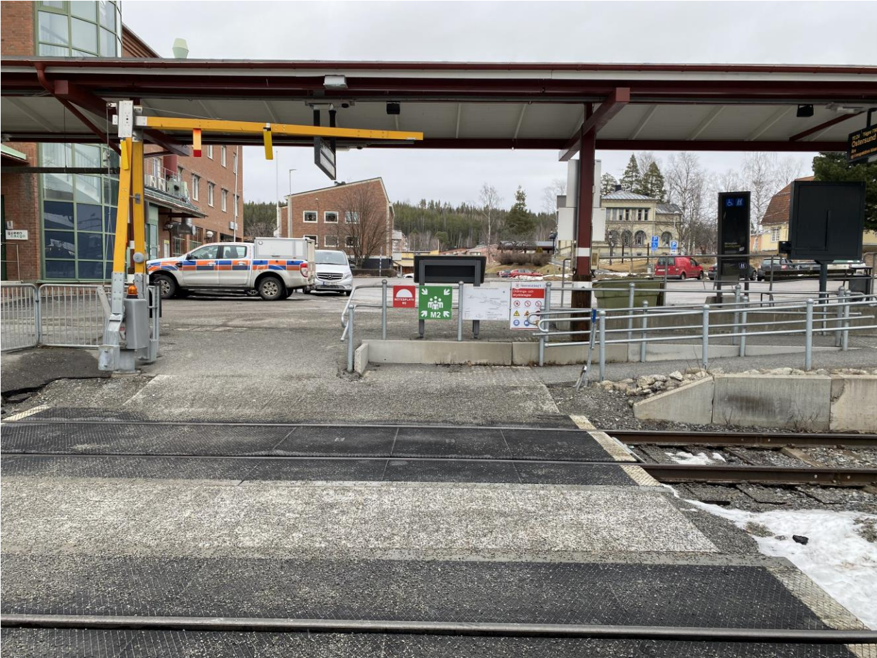
Plattformsförbindelsen är försedd med bommar och signal, men det är begränsad sikt och kort raksträcka innan kurva. Det är även brant lutning ner mot spåret.