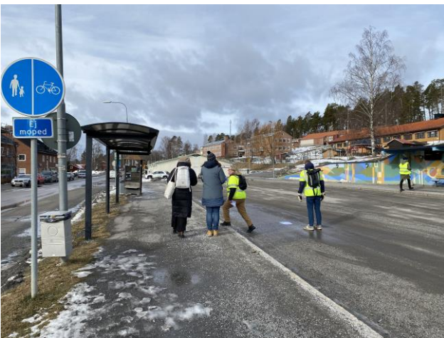
Busshållplatserna vid Fränsta bussterminal är inte tillgänglighetsanpassade.