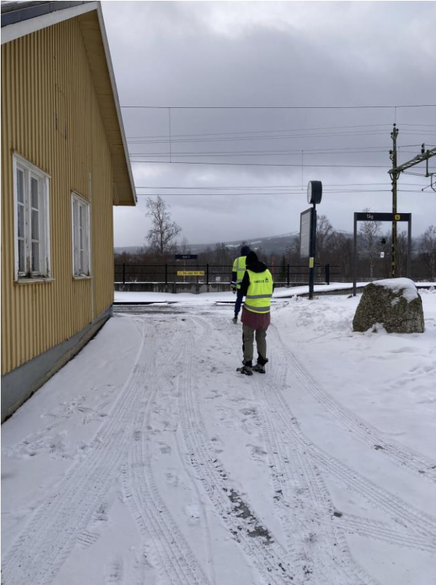
Brant lutning upp till plattform utgör ett hinder för personer med funktionsvariationer och resenärer med tungt bagage.