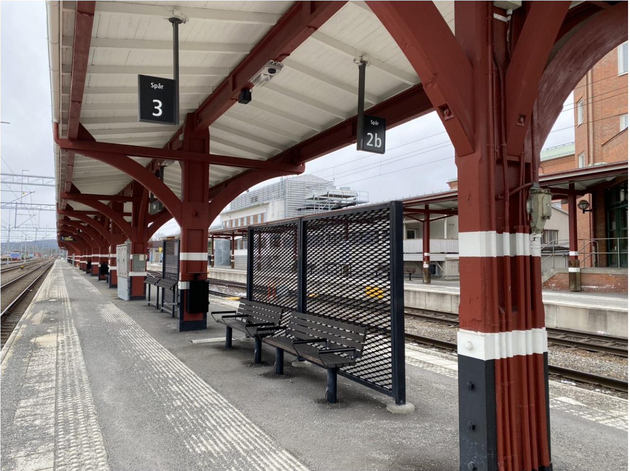
Plattform med plattformstak, god belysning, kontrasterande skyddszon, taktila stråk och tillgänglighetsanpassade sittplatser.