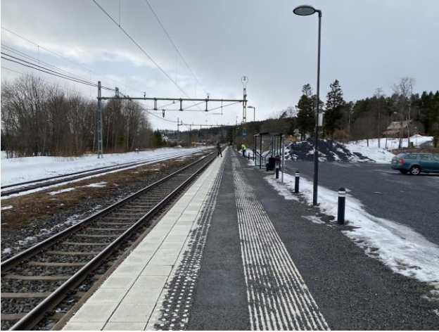
Plattform med kontrasterande skyddszon och taktila stråk.