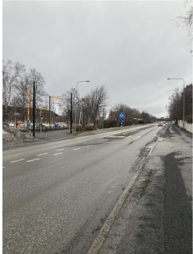
Provisoriska busshållplatser på Strandgatan som saknar taktila och visuella stråk, kontrasterande kantsten och sittplatser.