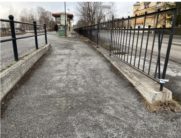
Ramper vid entréerna har inte ledstäng på båda sidor