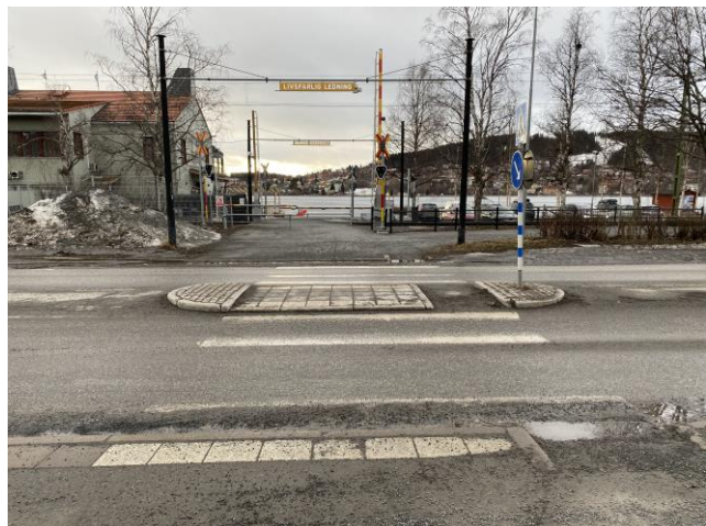
Bristande vägmarkeringar på övergångsställen över vägen