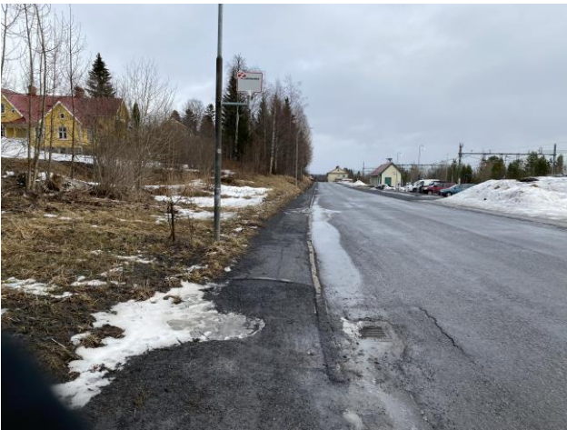
Busshållplatsen på den norra sidan saknar väderskydd, information och är inte tillgänglighetsanpassad.