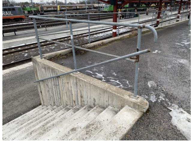
Det finns en gen koppling till plattformen från parkeringen i form av en brant trappa som inte är tillgänglighetsanpassad.