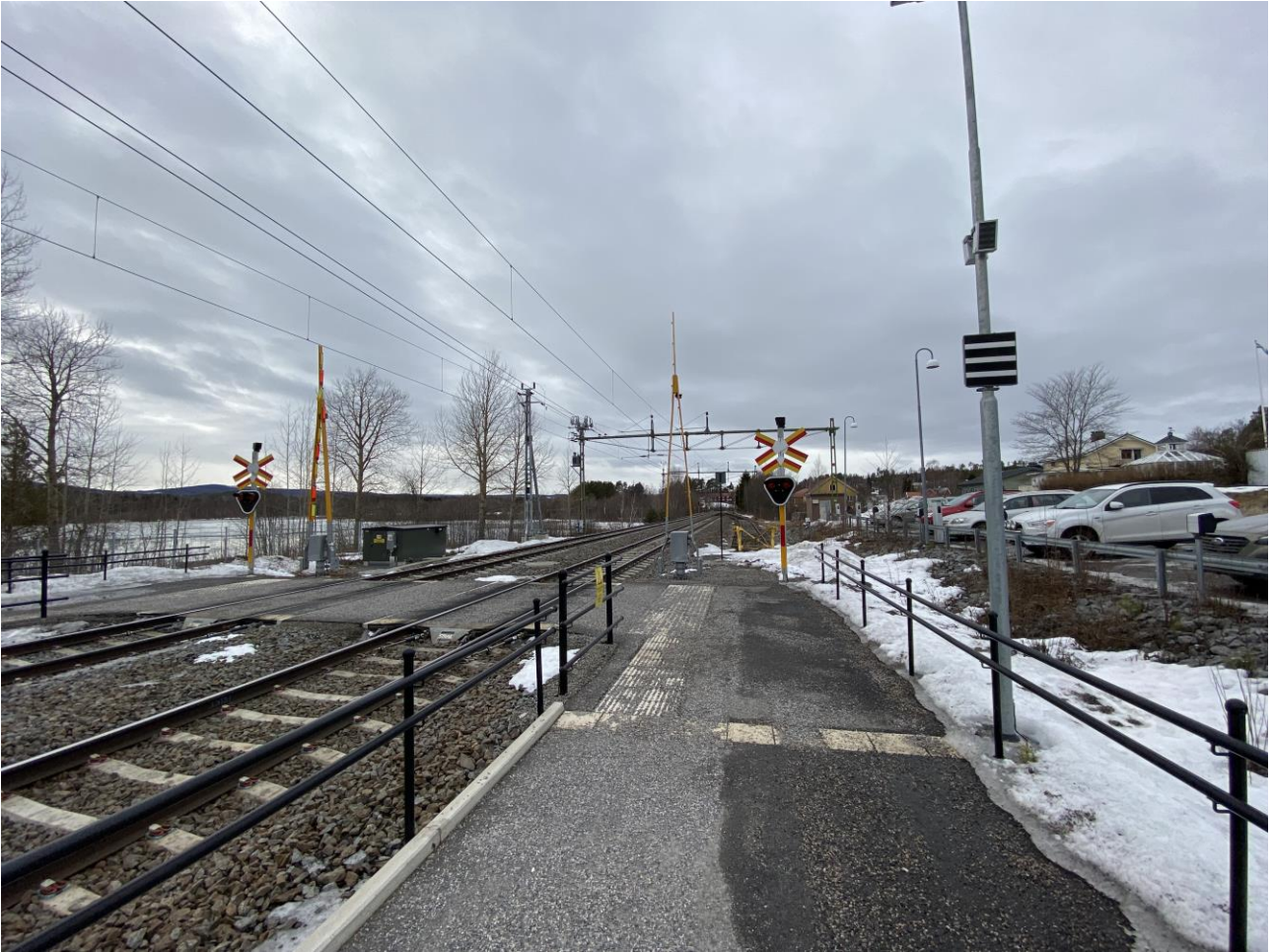
Plattformsförbindelse med bommar och signal, ramp till plattform med kontrastmarkering och ledstång på båda sidor och pendelparkering med laddstolpar i direkt anslutning till plattformen.