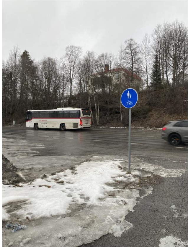
Det saknas passage över E14/E45 för resenärer som ska byta till buss i norrgående riktning.