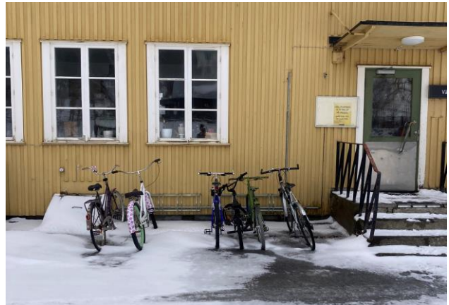
Entrén till stationshuset är inte tillgänglighetsanpassad.