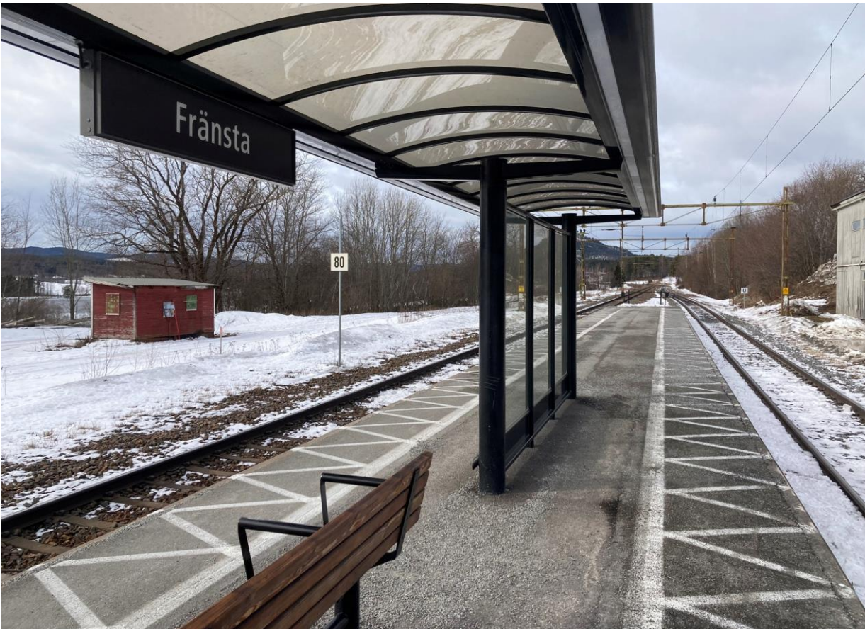
Plattformen har väderskydd med tillgänglighetsanpassade sittplatser men saknar kontrasterande skyddszon och taktila stråk.