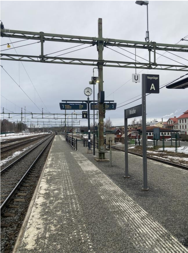
Plattform med kontrasterande skyddszon och taktila stråk.