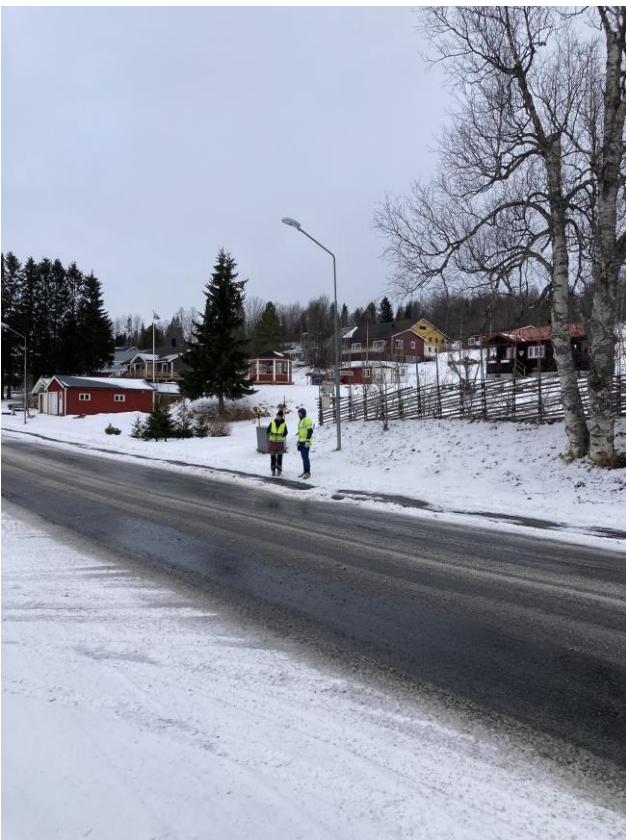
Det saknas passage för gående över Byvägen.