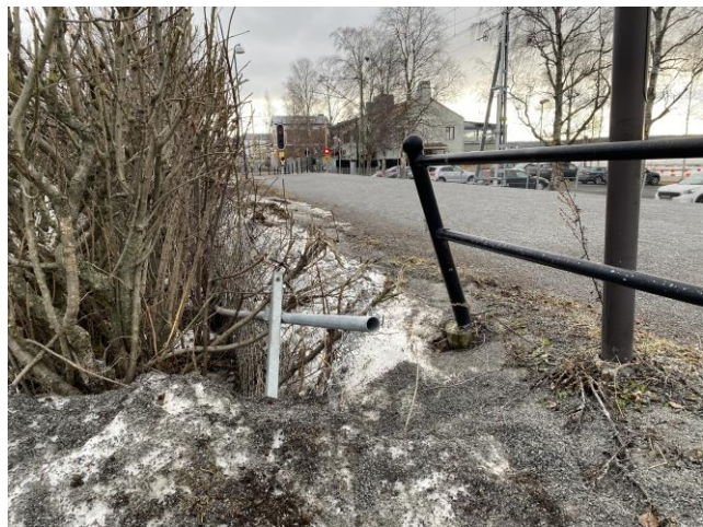
Ledstäng vid Samuel Permans gata har vält.