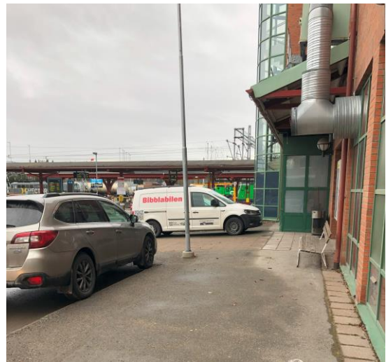
Stationshuset har en tydlig entré mot Järnvägsgatan, men byggnaden har en tydlig ”baksida” mot busshållplatsen och parkeringen. På denna sida är platsen framför stationshuset ostrukturerad och svår att överblicka.