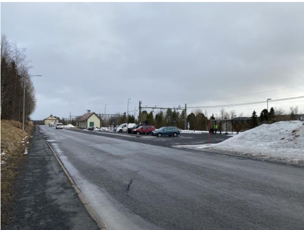
Det saknas en passage för bussresenärer mellan tågstationen och busshållplatsen.