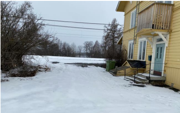
Det saknas tillgänglighetsanpassad entré till stationshuset samt från parkering och angöring upp till plattformen.