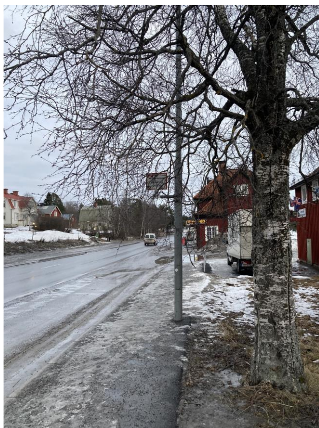
Otydlig placering och markering av busshållplats.