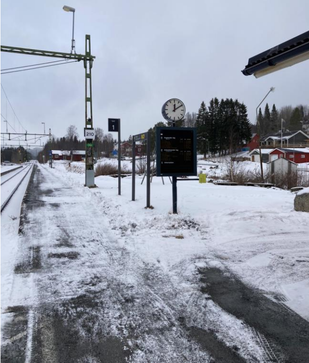
Plattform saknar kontrasterande skyddszon.