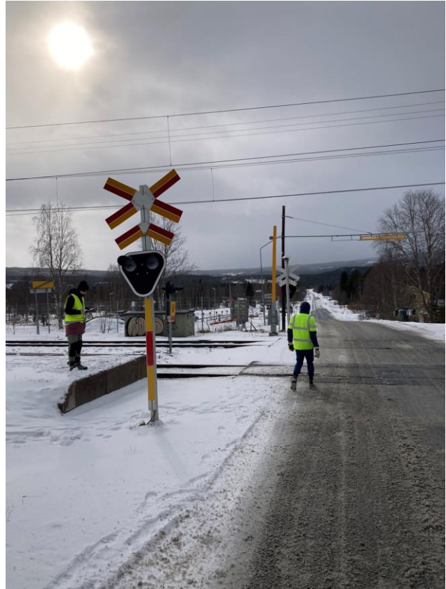
Det saknas gångförbindelse mellan pendlarparkering och plattform, det saknas även ramp/trappa upp till plattform.