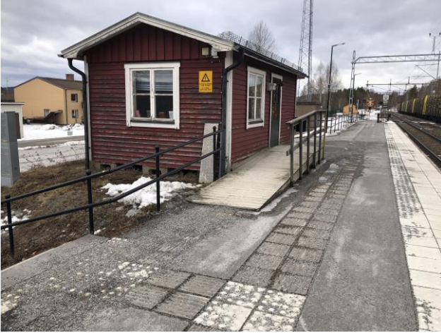
Det finns en uppvärmd väntkur i anslutning till tågstationen, entrén är inte tillgänglighetsanpassad.