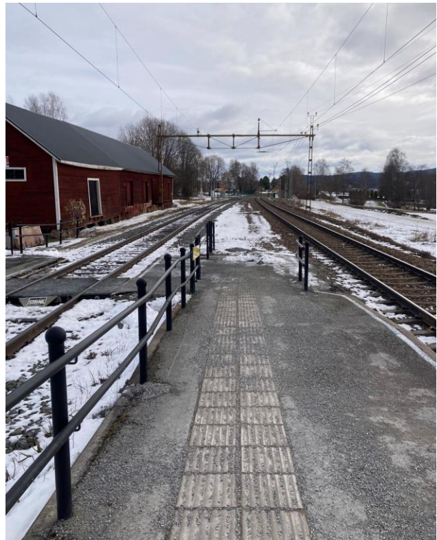
Det saknas kontrastmarkering och grind vid plattformens slut. Ramp har ej kontrastmarkering och ledstång på båda sidor.