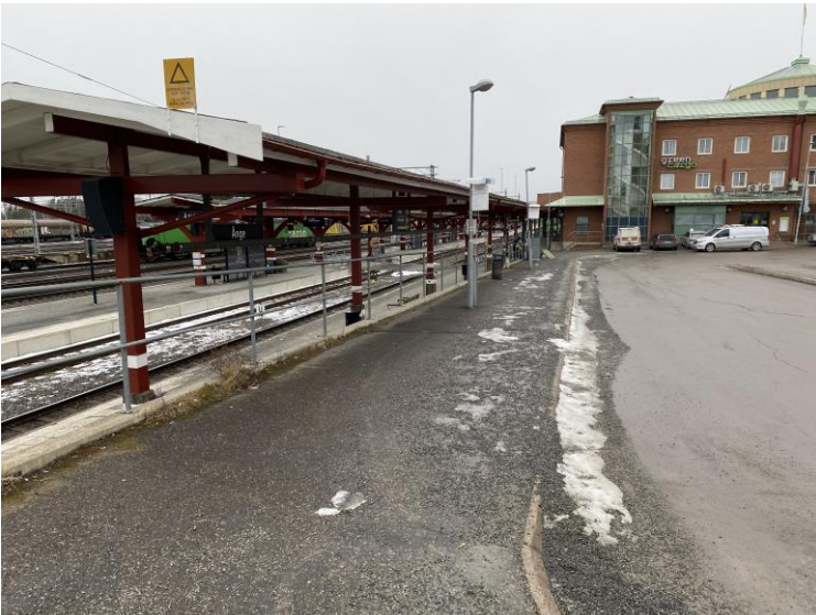
Busshållplatsen i anslutning till tågstationen saknar väderskydd, information och tillgänglighetsanpassning.