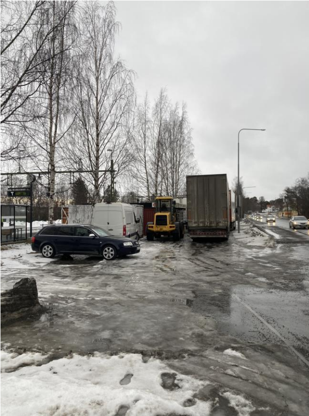
Uppställningsplats för fordon bidrar till begränsade siktlinjer och ökad otrygghet.