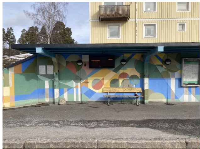
Placering mitt i byn och den öppna ytan med goda siktlinjer ger en känsla av att vara sedd som ger ökad trygghetskänsla.