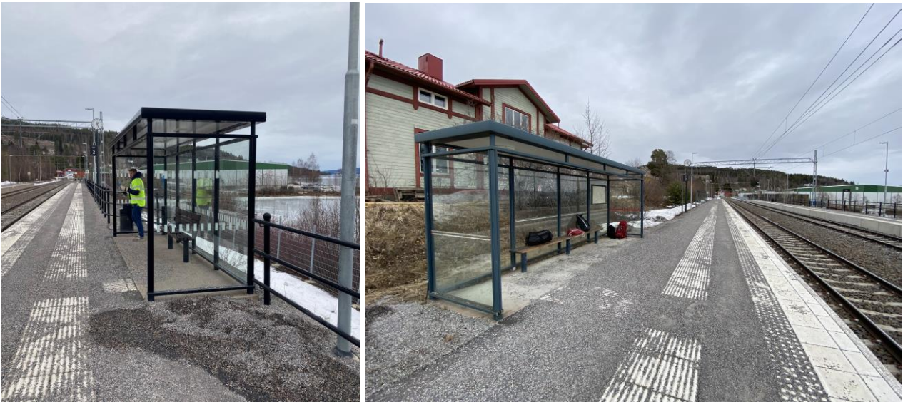
Väderskydd finns på båda plattformar, men det ena är av en äldre modell som saknar tillgänglighetsanpassade sittplatser.