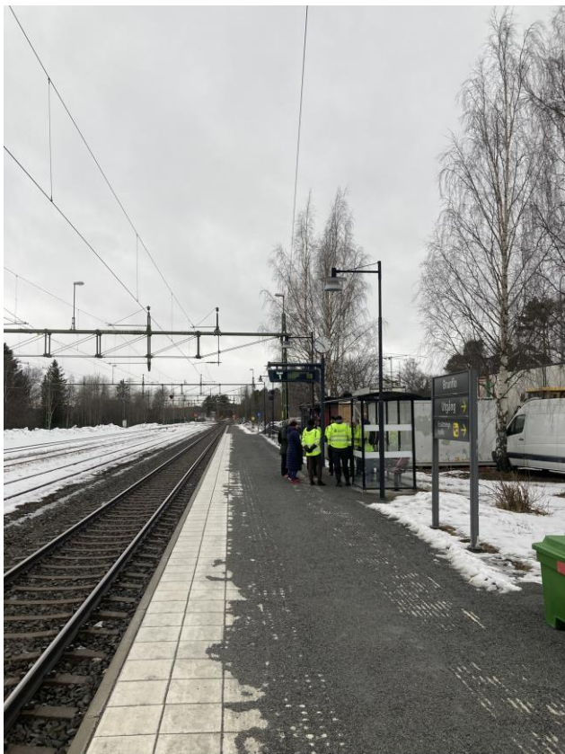
Plattform med kontrasterande skyddszon och taktila stråk.