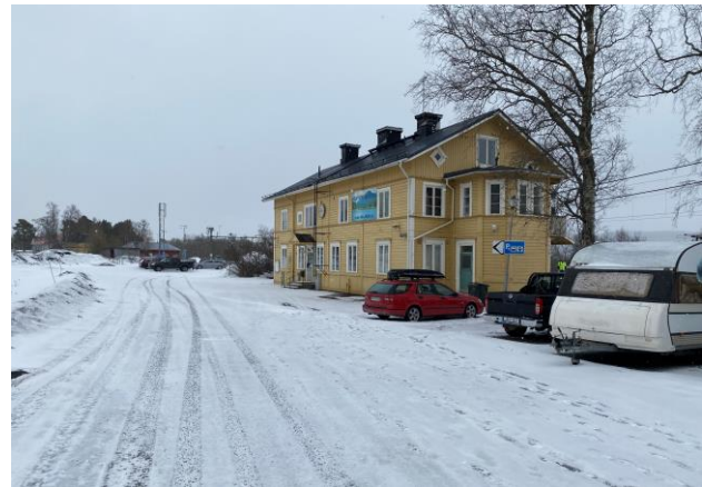
Det saknas gångföbinder fram till stationen, gångtrafikanter delar plats med motorfordon.