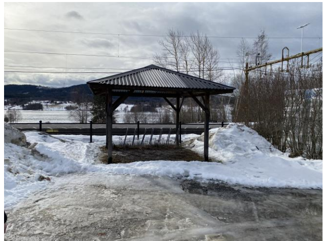
Bristande snöröjning vid cykelparkeringen som inte är optimalt placerad.