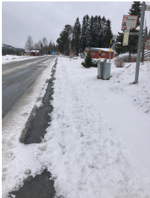
Bristande standard på anslutande busshållplatser.