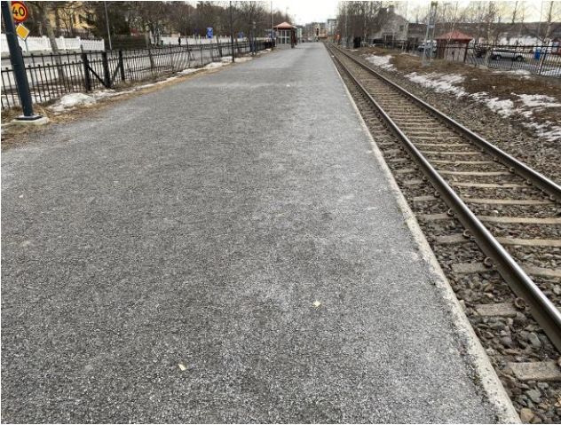
Skyddszone saknar kontrasterande varningsplattor