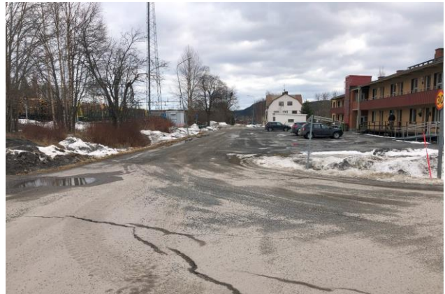
Vägen från tågstationen till busshållplatsen saknar bitvis gångbana, gångtrafikanter delar yta med motorfordon.