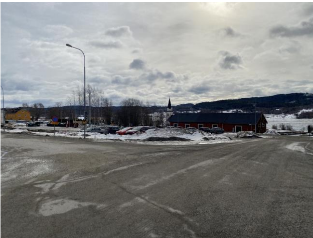
Det är stora parkeringsytor för bilar närmast stationen, parkeringsområdet är ostrukturerad med bristande belysning.