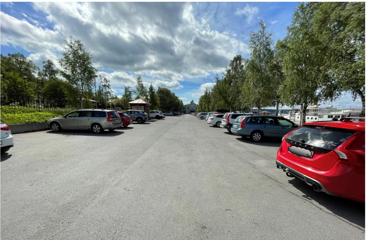
Stor parkeringsyta med bristande belysning och ostrukturerad användning (sommARBILD).