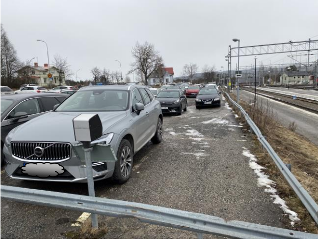
Ostrukturerad parkering med bristfällig belysning på själva parkeringen liksom vägen till busshållplats och stationshus.