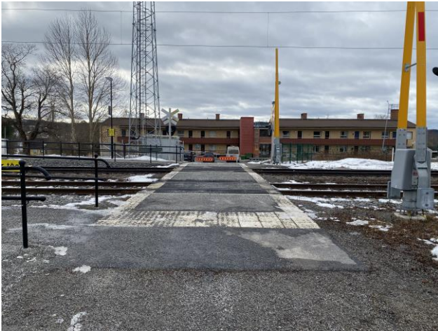
Plattformsförbindelse med bommar och signal.