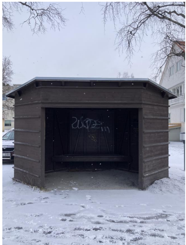
Busshållplatserna vid Järpens bibliotek saknar information och tillgänglighetsanpassning.