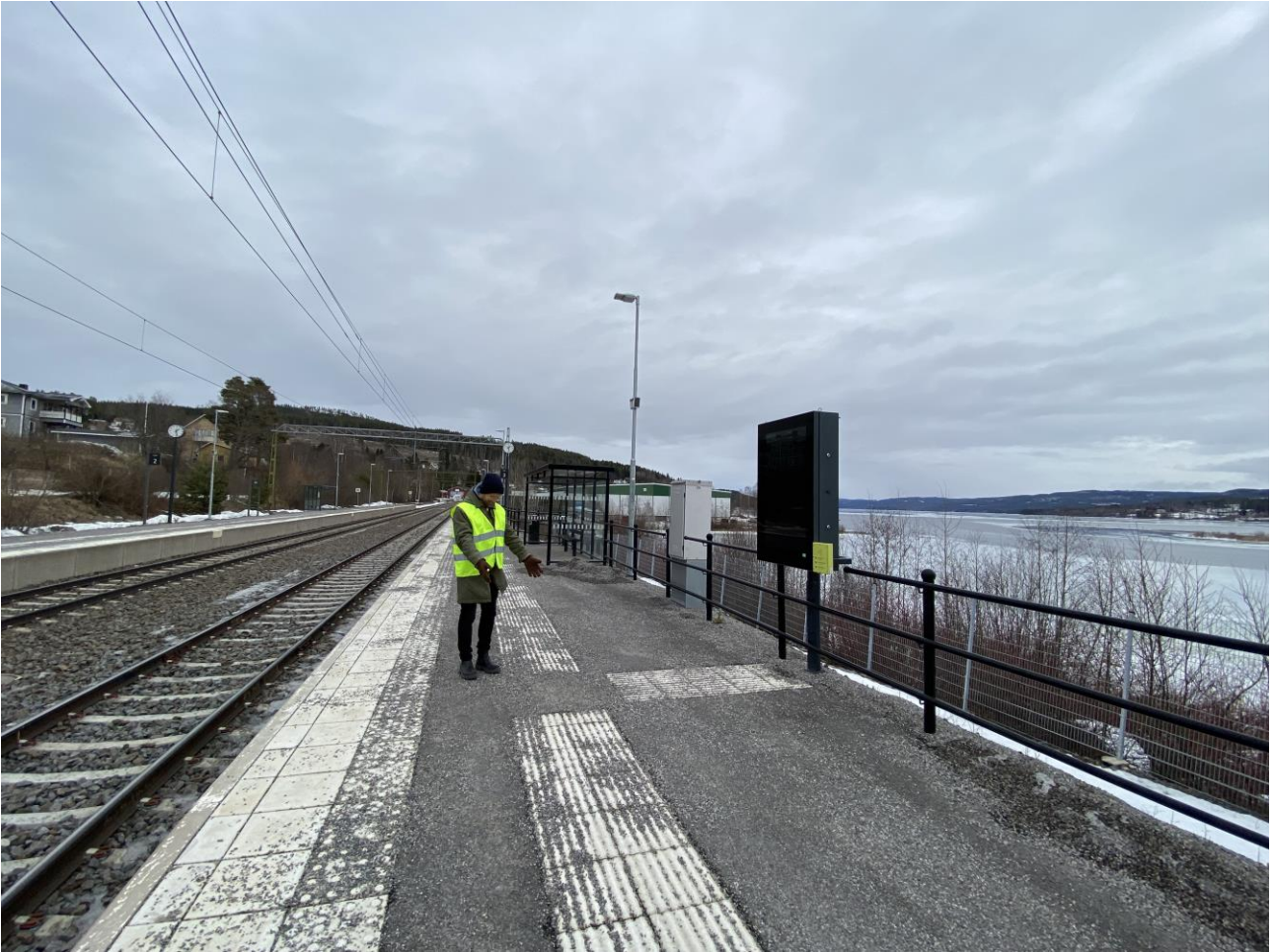
Plattformen är nyligen uppgraderad och har god belysning, kontrasterande skyddszon, taktila stråk och flertågsdisplayer mm.