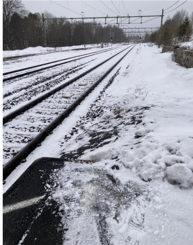
Det saknas grindar och varningsytor vid plattformens slut.