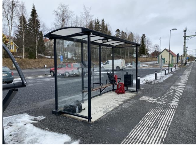
Väderskydd med tillgänglighetsanpassade sittplatser.