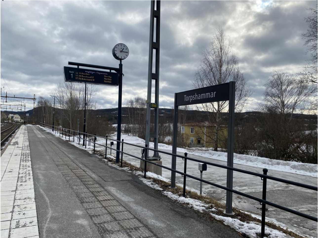
Plattformen är nyligen uppgraderad och har god belysning, kontrasterande skyddszon, taktila stråk och flertågsdisplayer mm.