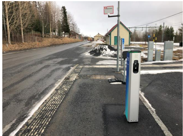
Hållplatsen närmast tågstationen har kontrastmarkerad kantsten men saknar väderskydd och trafikinformation.