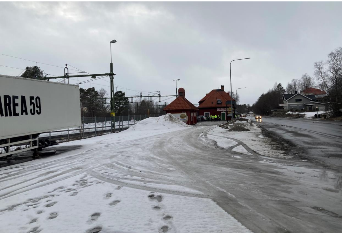
Stora och ödsliga parkeringsytor med bristande belysning och ostrukturerad användning.