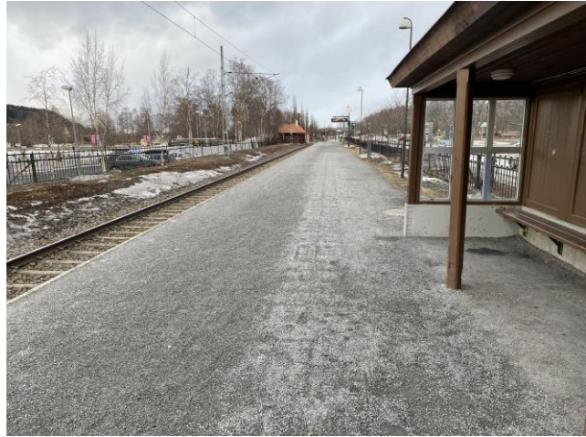
Sittplatserna är för få och är inte tillgänglighetsanpassade