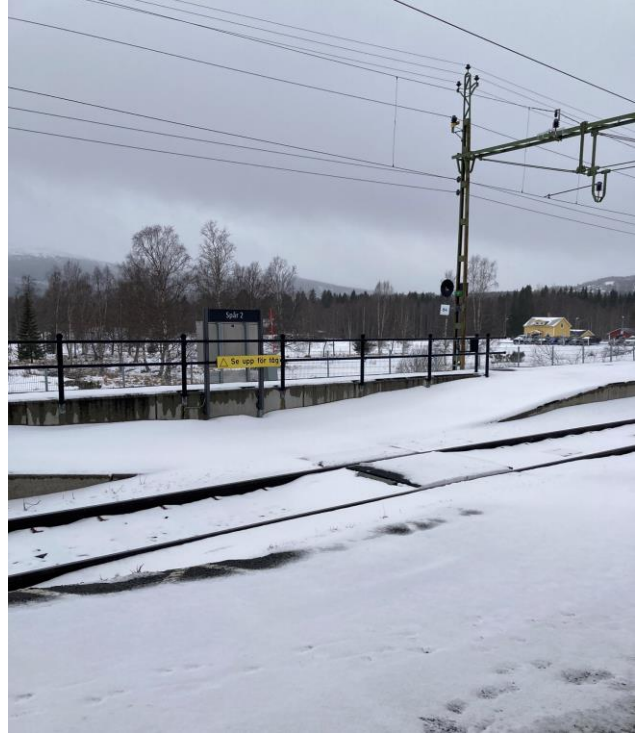
Plattformsförbindelsen saknar bommar, grindar och signal.