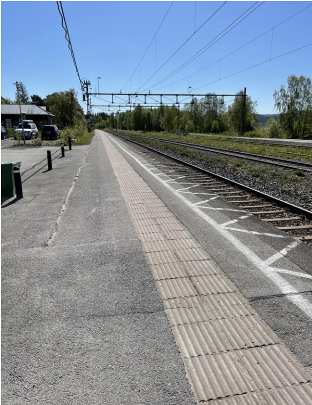
Plattform saknar kontrasterande skyddszon (sommARBild).