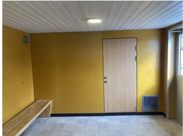
Det saknas automatisk dörröppnare och armstöd till sittplats.