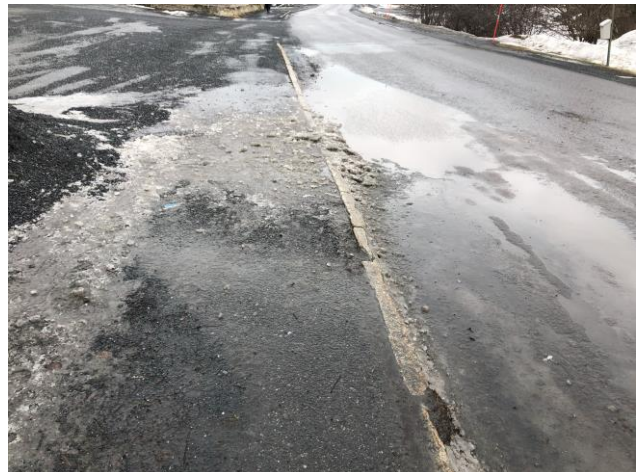
Gångbanan längs E14 är smal och har bristande beläggning vilket gör att det ansamlas vatten och bildas is.