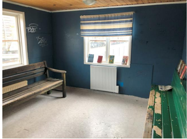
Det finns behov av generell uppgradering av väntkuren inklusive tillgänglighetsanpassning.