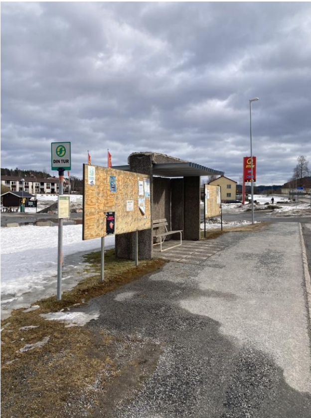
Busshållplatsen på Torpshammarsvägen saknar information och tillgänglighetsanpassning.