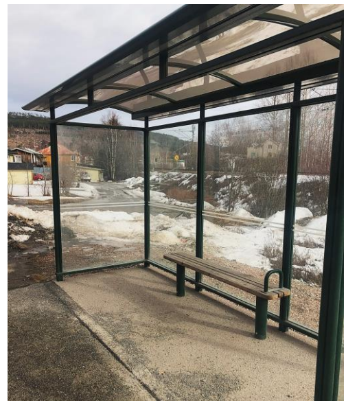
Busshållplatsen på Stödevägen saknar trafikinformation och tillgänglighetsanpassning. På ena sidan saknas även väderskydd.