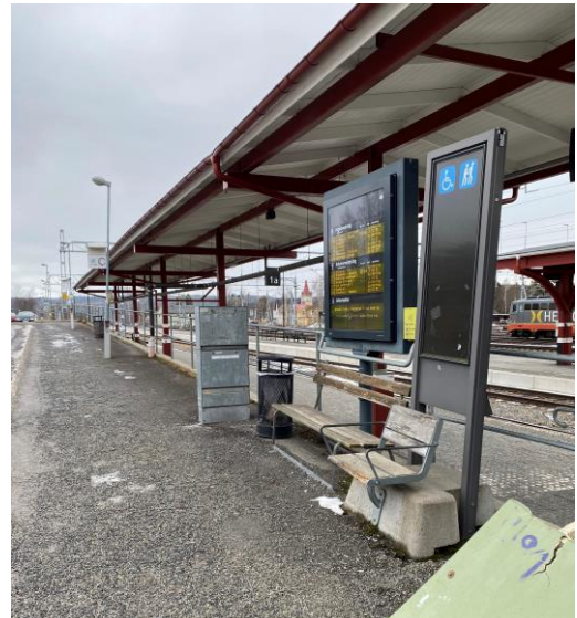
Det saknas taktilla ledstråk till mötesplats för ledsagning.