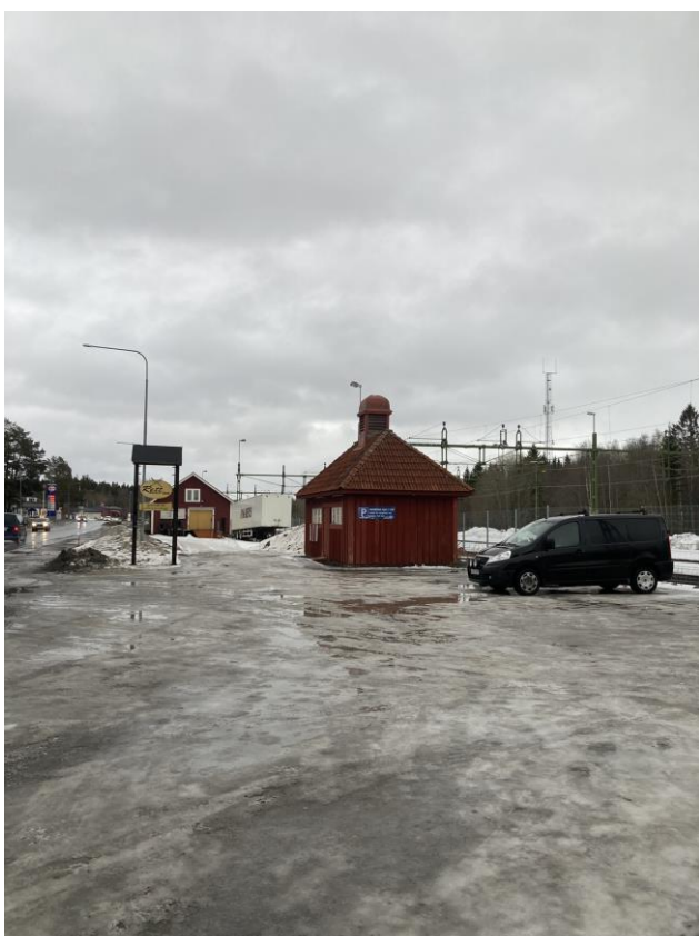
Bristande underhåll vid bytespunkten generellt.