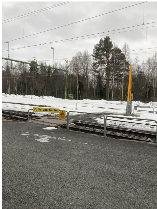
Plattformsförbindelse som leder rakt ut i spåret.