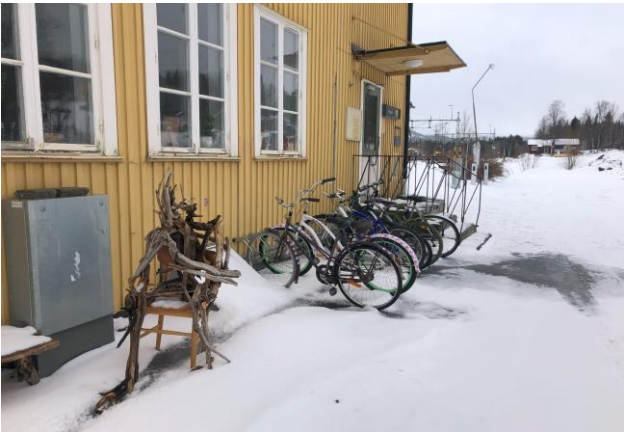
Det saknas väderskyddad cykelparkering med ramlåsning.