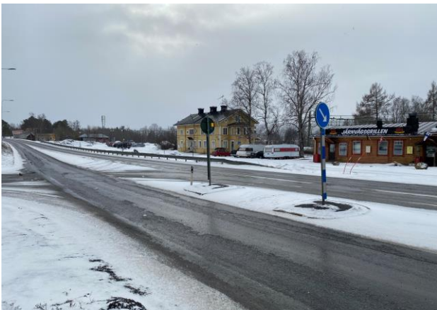
Det saknas ett hastighetssäkrat övergångsställe över E14 i anslutning till stationen.