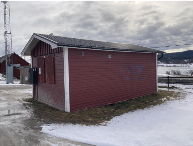
Det finns en uppvärmd väntkur i anslutning till tågstationen.