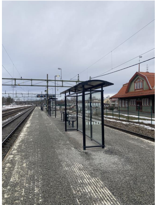
Väderskydd utan tillgänglighetsanpassade sittplatser.