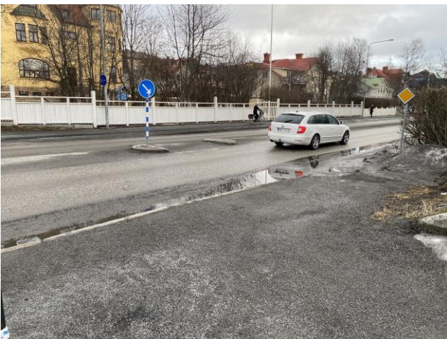
Vid Biblioteksgatan finns endast gångpassage över vägen